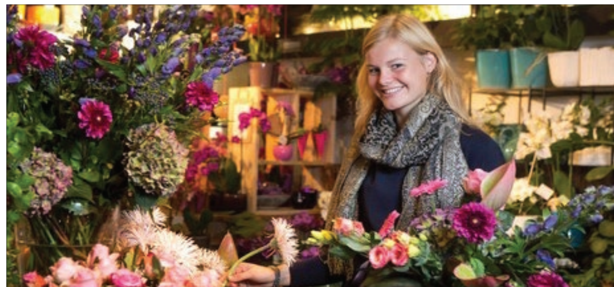
De btw-verhoging duwt zo'n 15% van de winkeliers over de rand van de afgrond, meent VBW.