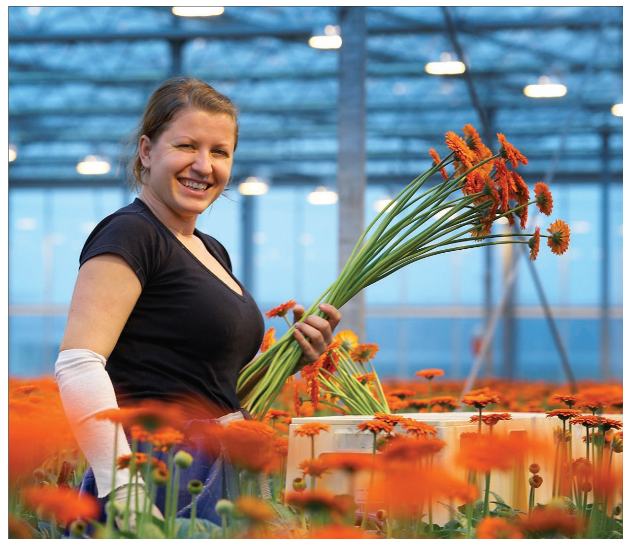
De nieuwe huisvestingsnormen gelden voor de huisvesting die tuinders zelf aan arbeidsmigranten aanbieden.