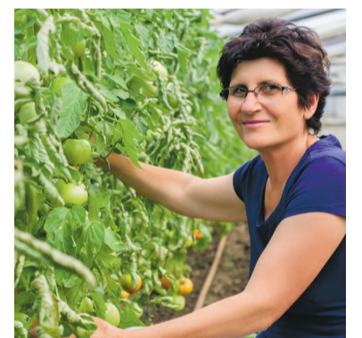
Glastuinbouw Nederland benadrukt het grote belang van de inzet van internationale werknemers voor de glastuinbouw.

Het debat maakte tevens duidelijk dat nadrukkelijk wordt gekeken naar gemeenten als het gaat om de realisatie van huisvestingsaanvragen in de regio's. “We zien dat er 100 miljoen euro budget voor 2020 en 2021 beschikbaar is ge-