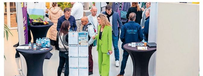
De Dag van de Tuinbouw vond vorig jaar ook plaats in World Horti Center.

Op woensdag 1 november organiseert World Horti Center een nieuw evenement genaamd 'Let's Meet!'.