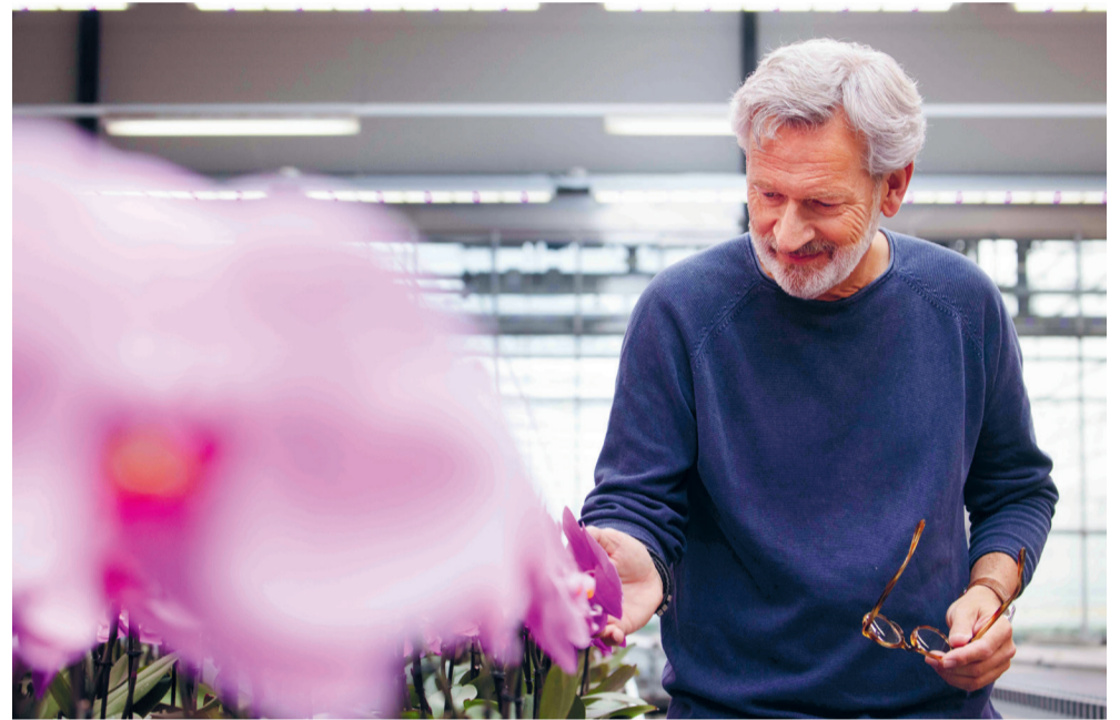
Het verhogen van de instroomleeftijd gebeurt in twee stappen.

Als oudere werknemer minder werken (80%) tegen 90% van het loon: dat is, in een notendop, de seniorenregeling in de glastuinbouw. Vanwege de gestegen kosten wordt de instroomleeftijd vanaf 1 januari 2024 in twee stappen verhoogd, van 62 jaar naar 63 jaar. Ook gaat de dagvergoeding omlaag.