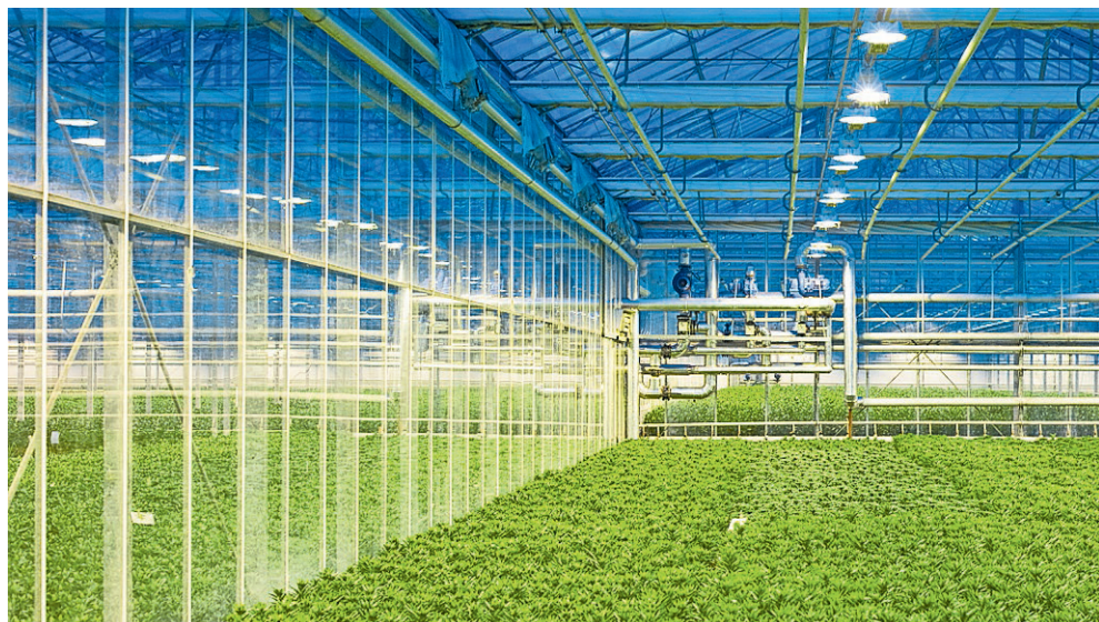
■ De glastuinbouw kan een essentiële rol blijven spelen in het elektriciteitssysteem.

Glastuinbouwbedrijven zetten steeds meer in op het flexibel kunnen afnemen van elektriciteit, bijvoorbeeld voor belichting of voor het vullen van batterijen en warmtebuffers voor later gebruik. Later ontstaan mogelijk kansen voor waterstof-WKK's of groen gas WKK's. De glastuinbouw kan een essentiële rol blijven spelen in het elektriciteitssysteem, mits ze blijft innoveren.