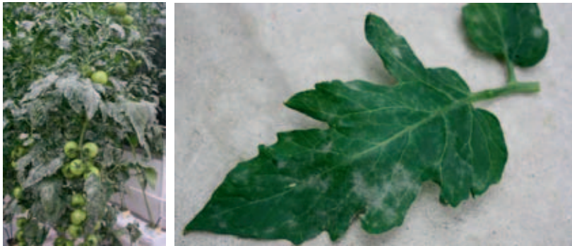
Figuur 1.1 Symptomen van echte meeldauw in een tomatengewas.

Doordat de sporen zelf relatief veel vocht bevatten kunnen ze zich goed ontwikkelen bij relatief lage luchtvochtigheden (60-80%) en warme temperaturen (optimum rond 22 °C). Ook bij hogere luchtvochtigheden is sporenkieming en mycelium-groei nog steeds goed mogelijk. Whipps & Budge (2000) laten in een kasproef met verschillende relatieve vochtigheden (temperatuur is constant op 19 °C), zien dat voor Oidium lycopersici in tomaat het optimum voor infectie kan variëren tussen relatieve luchtvochtigheden van 80 en 90% en dat bij een relatieve luchtvochtigheid van 95% er een verminderde sporenkieming (50-75%) plaatsvindt. De meeste meeldauwsporen kiemen niet goed in vrij water en een behandeling met water remt dan ook vaak de myceliumontwikkeling (Sivapalan 1993).