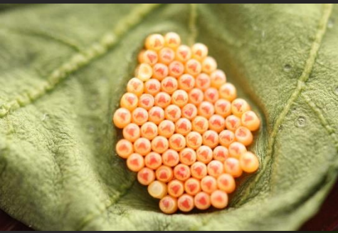
Cluster eieren, ca. 60-90 eieren