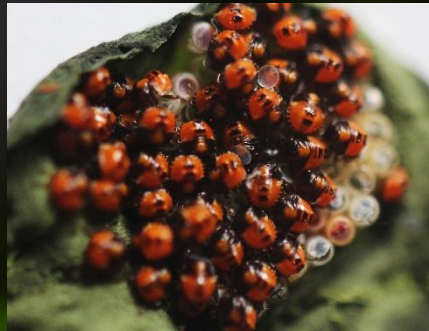
1 e stadium nimf, ± 1 mm