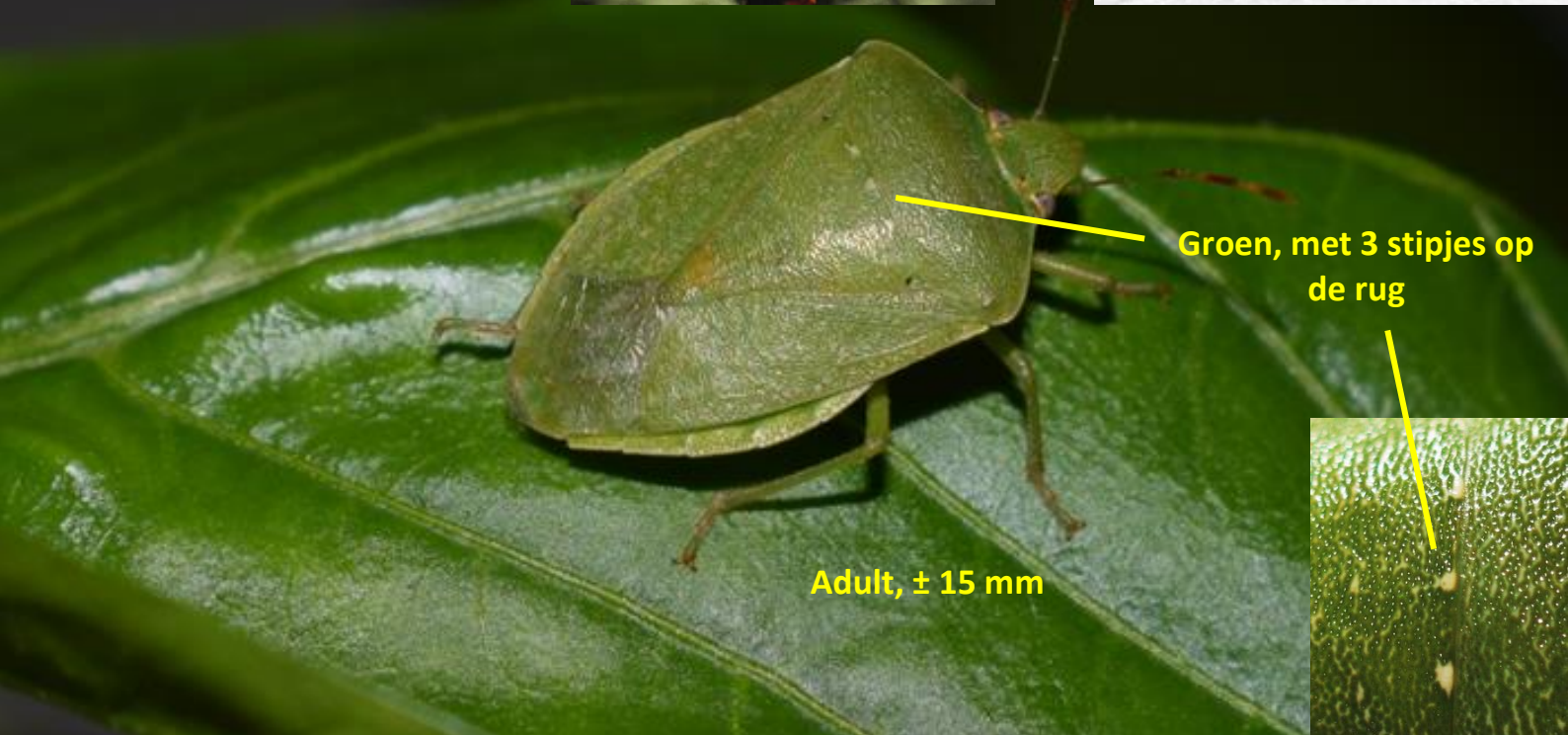
Adult, ± 15 mm