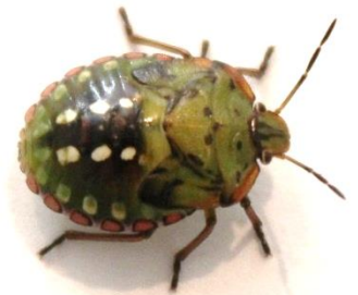
5 e stadium nimf, ± 13 mm

Heb je dit insect aangetroffen? Geef het door aan de teler!