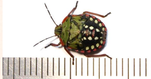
4 e stadium nimf, ± 10 mm