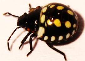
3 e stadium nimf, ± 5 mm