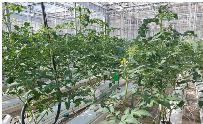
Figuur 2. Kasproef tomaat.