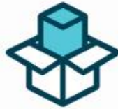
UITBREIDINGSPAKKET VIALUX E-LINE MODULE