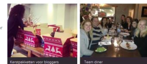
Kerstpakketten voor bloggers