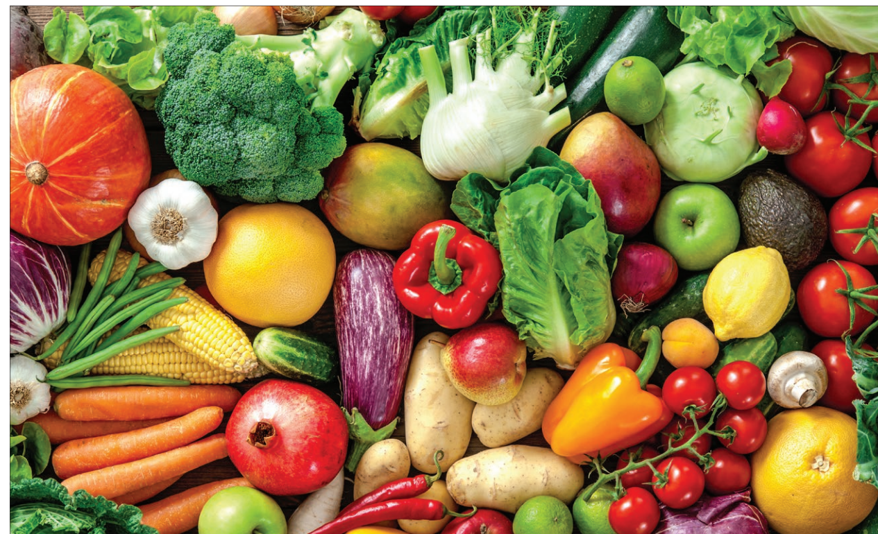
De overheid wil dat jongeren meer groenten en fruit eten.