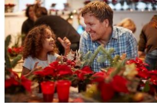
Klaas van Kruistum maakt kerststerdecoraties samen met de kinderen van gezinsopvang de Roggeveen

In aanloop naar de jaarlijkse Dag van de Kerstster op 12 december verraste presentator en TV-persoonlijkheid Klaas van Kruistum - bekend onder andere van KRO-NCRV programma's als Zapplive, de Rekenkamer en zijn deelname aan Wie is de Mol? - de bewoners van gezinsopvang de Roggeveen in Amsterdam met honderden Kerststerren. Hiermee lieten Klaas van Kruistum en initiatiefnemer Stars for Europe, in samenwerking met stichting HVO-Querido, de gezinnen even hun zorgen vergeten en toerden ze de complete opvang om tot een waar kerstparadijs. Het initiatief is geïnspireerd door de traditie waarbij mensen elkaar op de Dag van de Kerstster een Kerstster cadeau geven om elkaar een warm hart toe te dragen en in het zonnetje te zetten rondom de feestdagen.