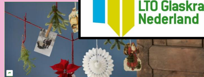
Magische herinneringen met de Kerstster dinsdag 06 december 2016

De Sinterklaasperiode is voorbij en Nederland is klaar om kerst in huis te halen. Er is geen enkele andere periode die zo veel mooie (jeugd)herinneringen naar boven haalt als Kerstmis. De promotie van de Kerstster in Nederland richt zich dit jaar dan ook volledig op het thema 'Memories'. Het beeld van fonkelende lichtjes, cadeautjes die met liefde zijn ingepakt en lateraard de Kerstster die het huis met haar mooie kleuren vult. De thema's van de Stars for Europe communicatiecampagne van dit jaar koppelen de plant onherroepelijk aan de (jeugd)herinneringen van Kerstmis, waardoor de plant onderdeel wordt van de speciale momenten die samen kerst vormen.